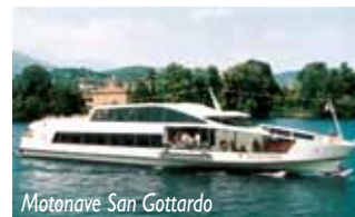
Motonave San Gottardo